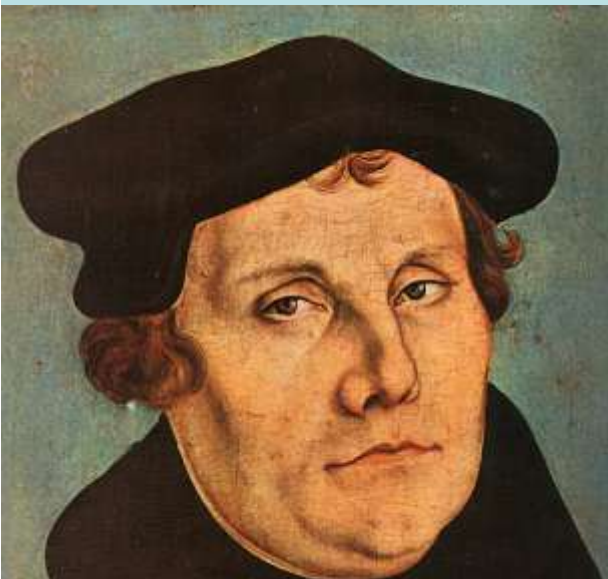
Мартин Лютер 1483-1546