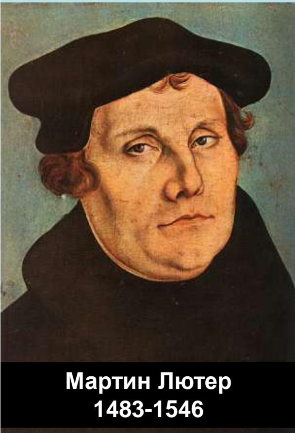
Мартин Лютер 1483-1546

Тезисы неожиданно широко распространились через печать.