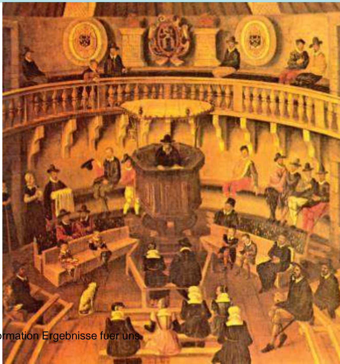
Reformation Ergebnisse fuer uns