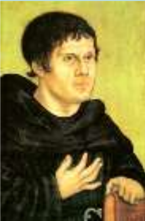
Мартин Лютер 1483-1546

Мартин Лютер родился 10.11.1483 в Саксонии, в семье семеро детей.