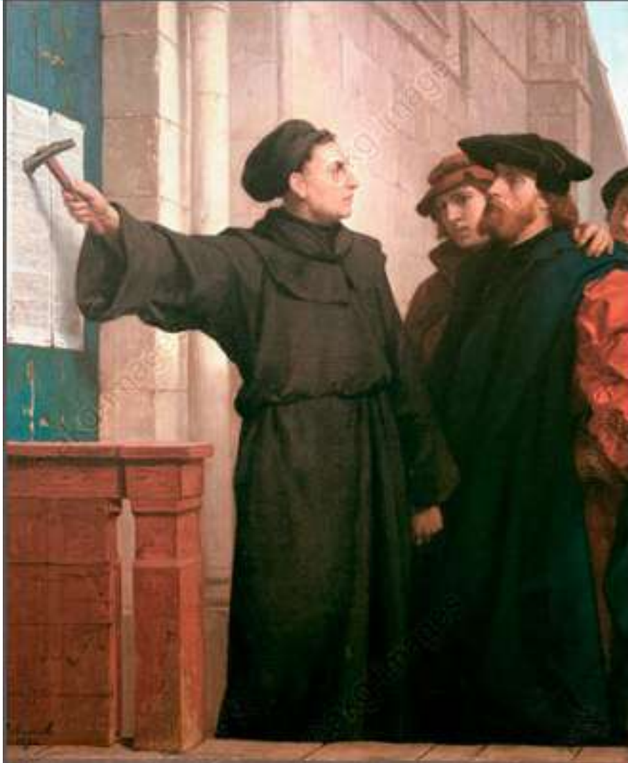
Martin Luther 1483-1546

Иеромонах Мартин Лютер противостал торговле индульгенциями